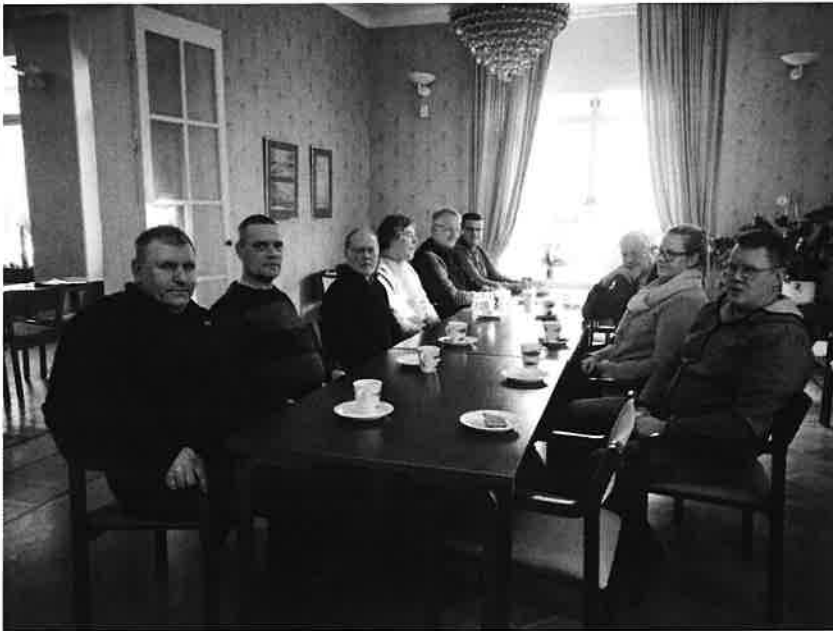
Hallituksen jäsenet Pyhäjärvi-instituutissa.